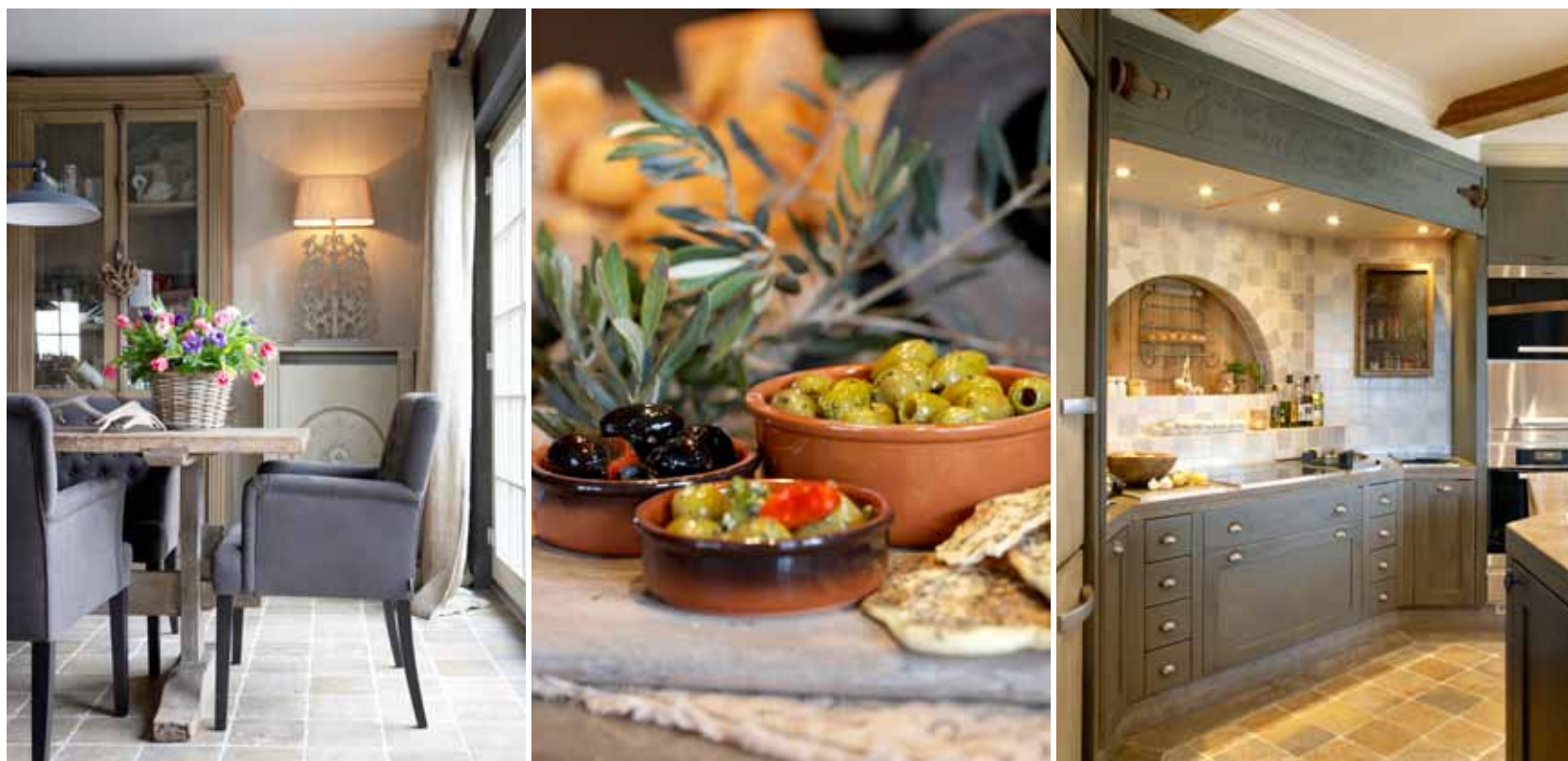
Foto's rechts en rechterpagina: de bestaande opstelling van de open keuken paste wonderwel beter bij het nieuwe concept dan bij het oude. Het werd een echte landelijke woonkeuken die naadloos aansluit bij de woonkamer.

Muren werden voorzien van sierlijke lijsten en lambriseringen, oude ornamenten en bouwmaterialen werden gezocht om de saaie strakke muren van hal en overloop dynamisch te maken. Er kwam een perfecte combinatie van mooie kroonluchters, stijlvolle wandlampen en