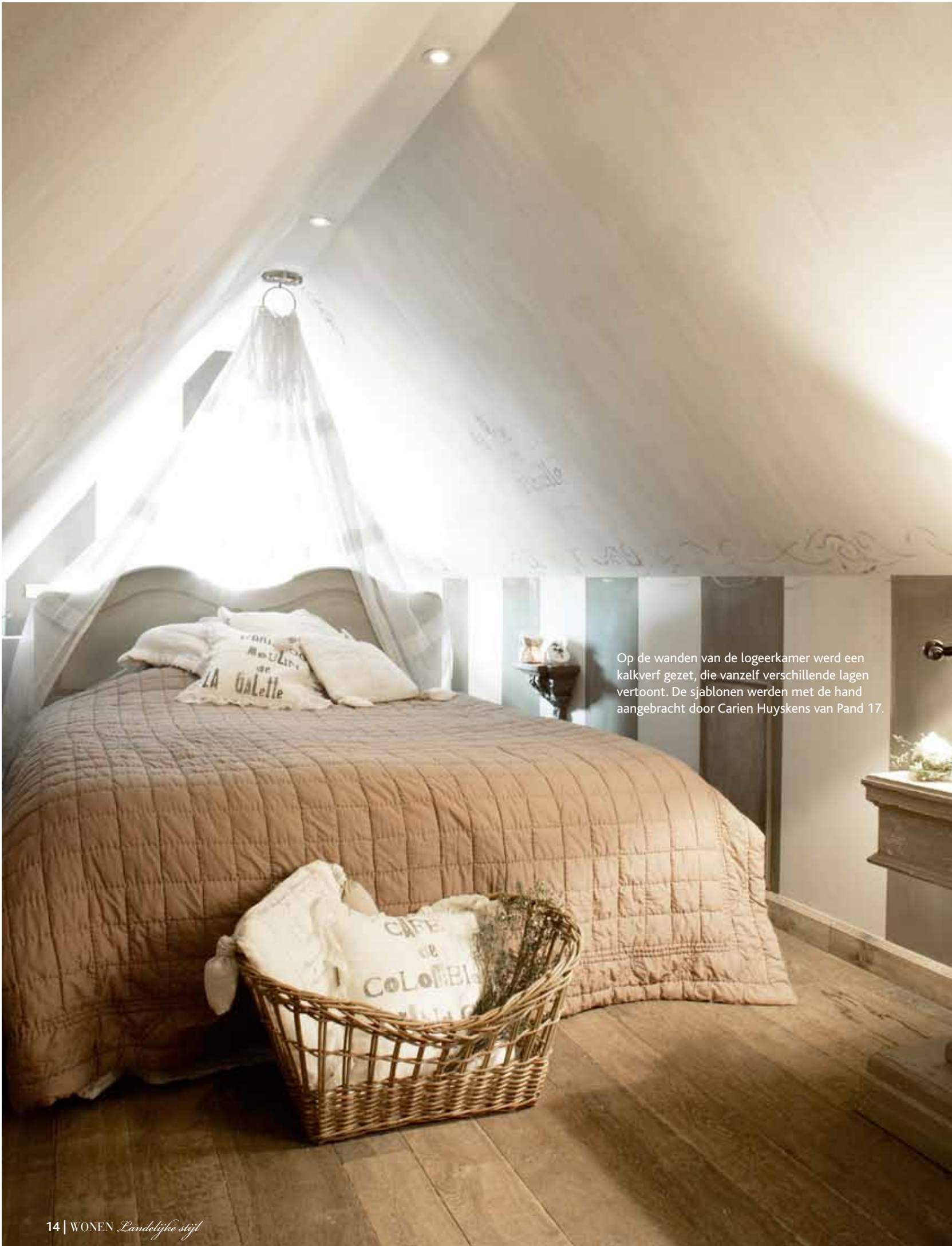
Op de wanden van de logeerkamer werd een kalkverf gezet, die vanzelf verschillende lagen vertoont. De sjablonen werden met de hand aangebracht door Carien Huyskens van Pand 17.