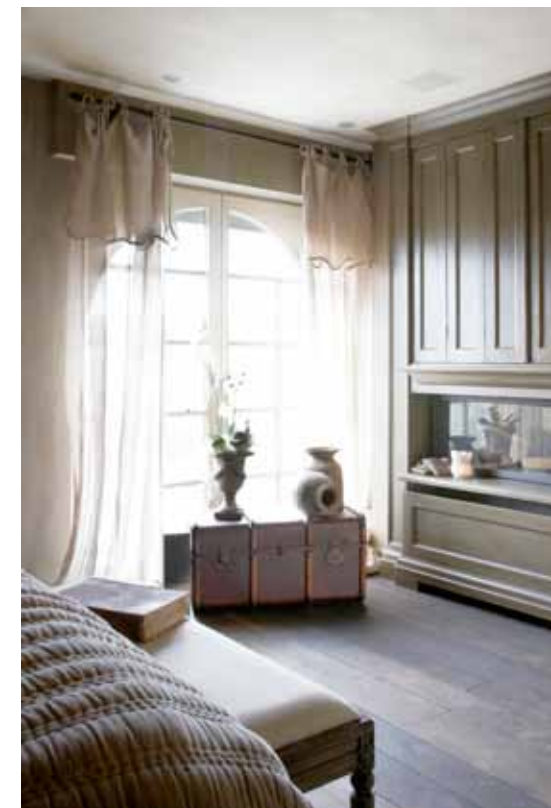
Foto links: een doorkijkhaard bedient zowel de slaapzone als de aanpalende badzone. Foto midden: een romantisch lavabomeubel kwam in de plaats van een strakke, sfeerloze wastafel.

Ook de keuken onderging een spectaculaire metamorfose, maar dan zonder één meubelstuk te verplaatsen. De opstelling in de hoek leende zich namelijk prima tot de gekozen landelijke stijl. In de aanpalende woonkamer verdwenen twee moderne inbouwhaarden en een deel van de domotica, in de plaats daarvan kwamen een mooie zandstenen open gashaard, een op maat gemaakte wandkast, nieuw zitmeubilair met zachte stoffen en warme kussens, sfeerlampen, passende decoratie en juten gordijnen. Opnieuw één en al verrassing: Jean en Nadine kwamen op eigen verzoek pas kijken toen alles af was, tot en met de gedekte tafel én een versierde kerstboom. De eigenaars waren tot tranen toe geroerd. Slechts een enkel stuk ging weer de deur uit, al het overige werd met open armen ontvangen. Geen vierkante centimeter bleef onbehandeld. Ze ontdekten nog af en toe iets nieuws en zijn dolgelukkig. Ze hebben eindelijk hun stek gevonden en nodigen oude en nieuwe vrienden – de ontwerpers bijvoorbeeld – maar wat graag uit aan de gloednieuwe feesttafel!